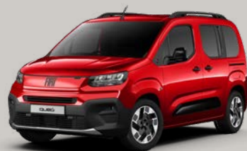
Červená Passione (JJP-182)