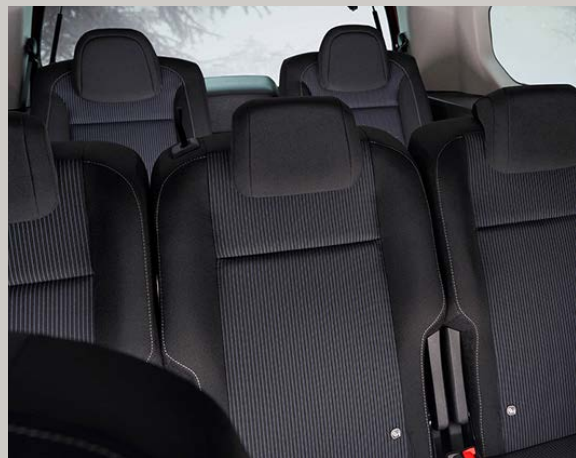
Černo-šedá látka s vinylovým pruhem na opěradle s logem Fiat (142)